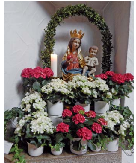
HI. Familie Donaustetten