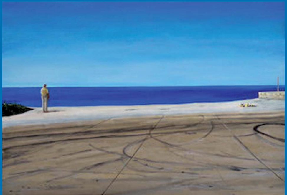
Bild: Andreas Jauss, Selbst (Schauend) , 2018 | Öl auf Leinwand 70 x 100 cm

Menschen, die wie ich selbst unterwegs sind und nochmals kurz innehalten. Auch das Innehalten gehört dazu. Unterwegs zu sein ist etwas zutiefst Menschliches, etwas Archaisches. Quer durch alle Epochen der Menschheitsgeschichte, quer durch alle Kulturen, haben Wege eine große Bedeutung. Christus spricht: „Ich bin der Weg, die Wahrheit und das Leben. Niemand kommt zum Vater außer durch mich“. Christ sein bedeutet unterwegs zu sein.