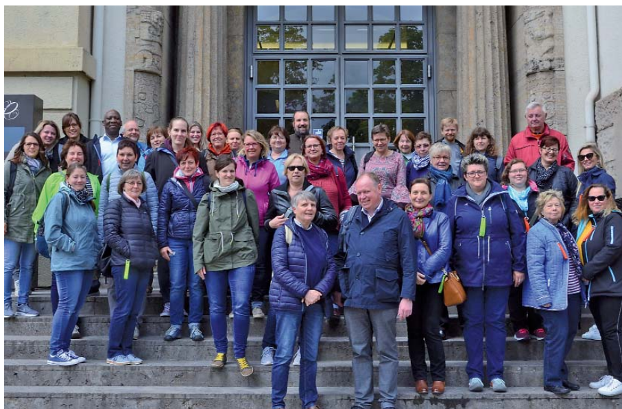
Mitarbeiter der Seelsorgeeinheit beim Betriebsausflug