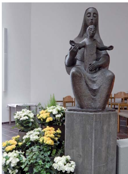
St. Franziskus Tannenplatz