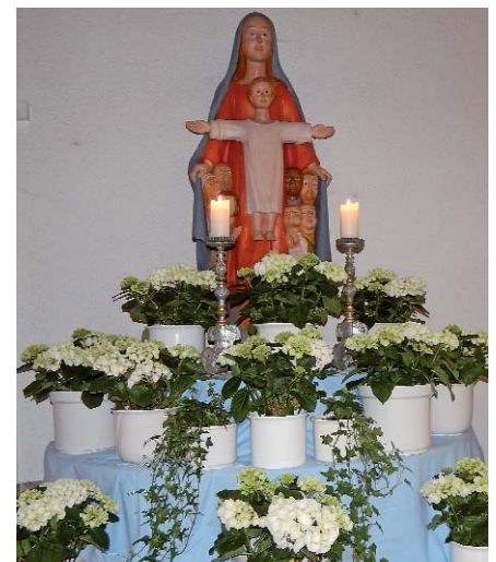
HI. Kreuz Göggingen