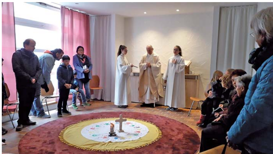
Neuer Meditationsraum Donaustetten