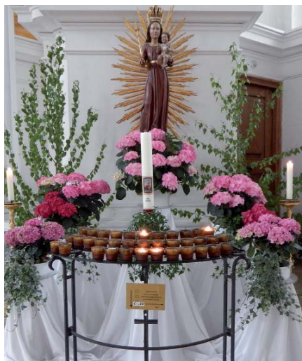
Basilika St. Martin Wiblingen