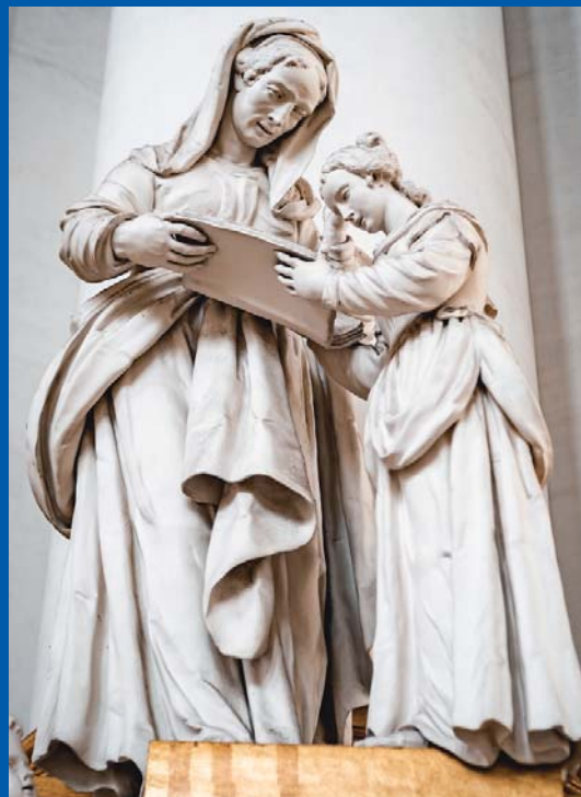
Foto: Hl. Anna, Oma von Jesus mit ihrem Kind Maria

Was Großmutter noch wusste, ist oft schon verloren gegangen. Doch manches davon wird in unseren Tagen neu entdeckt, für wertvoll empfunden und wieder praktiziert. Vielleicht gilt dies ja nicht nur für Tipps zu Haushalt, Garten und Küche. Vielleicht ist das mit dem Lebens- und Erfahrungswissen um das Geheimnis Gottes und die Sache Jesu ebenso? Großeltern sind somit nicht nur Zeugen für gelebtes und erprobtes Leben sondern auch für tiefsitzendes Gottvertrauen. Sie können für Lebensmut in herausfordernden Lebenssituationen und für Versöhntheit mit unserer Zeit und Welt stehen – und darin, in der Perspektive des Glaubens, letztlich mit Gott. Großeltern können für ihre Enkel eine ansteckende „Lebenskunst“ wie auch einen gewachsenen und gereiften Glauben ausstrahlen.