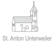
St. Anton Unterweiler